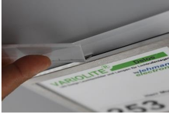
Halteklammer mit stumpfen Gegenstand zurückdrücken