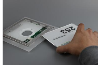
Mit der Acrylglasscheibe die Klammer zurückdrücken