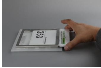
Jetzt die Acrylglasscheibe herausziehen